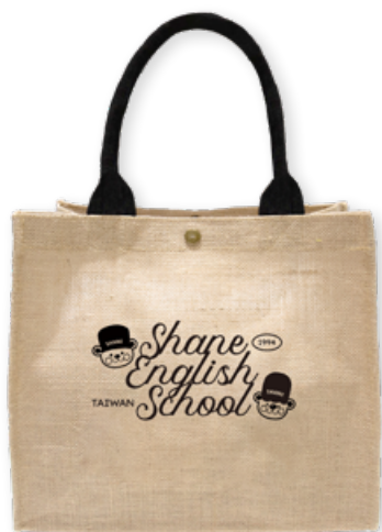
• 夏恩草寫環保麻布袋