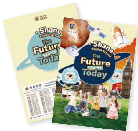
• 2025 夏恩英語招生 L 夾