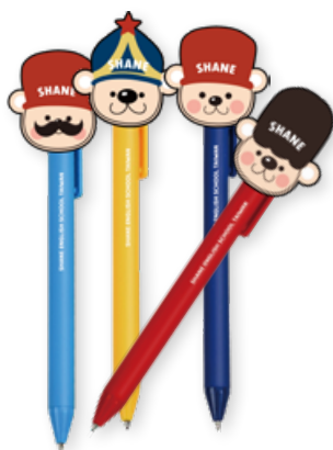
• 夏恩熊造型原子筆