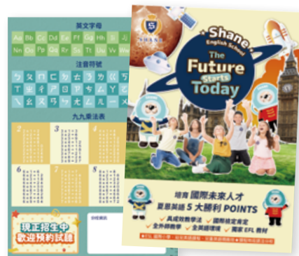
• 2025 夏恩英語招生墊板